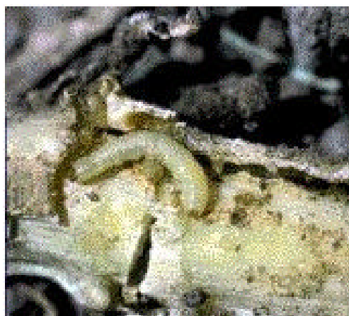
Figure 4 : Larve de chrysomèle se nourrissant sur une racine de maïs.

Les larves de la chrysomèle des racines migrent dans le sol vers les racines des jeunes plants de maïs. Elles se nourrissent de ces racines (figure 4) pendant une période de 3 à 4 semaines jusqu'à ce que leur développement soit complet à la mi-juillet environ.