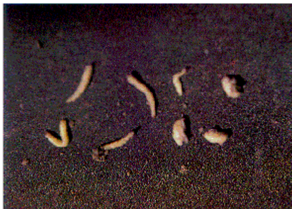
Figure 3 : Larves de chrysomèles des racines du maïs au développement complet mesurant 1,5 cm de long; le corps est blanc, la tête et l'extrémité sont brunes.

Les adultes pondent de petits oeufs blancs et ovales de moins de 0,1 mm de longueur. Les oeufs hivernent dans le sol et commencent à se développer au printemps quand la température du sol atteint 10 ou 11 °C. Après leur émergence, les larves commencent à envahir les racines du maïs à partir de la mi-juin. Les jeunes larves sont des vers minces et cylindriques au corps blanc muni de six petites pattes situées juste derrière la tête de couleur brune (figure 3). Les chrysomèles des racines du maïs passent par trois stades larvaires (mue) avant de devenir adultes. Lorsque leur développement est complet, les larves mesurent environ 1,5 cm.