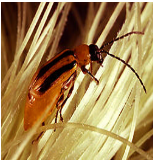
Figure 1 : adulte de Diabrotica virgifera virgifera

La chrysomèle des racines du maïs, insecte Coléoptère, est le principal ravageur du maïs en Amérique du Nord (Etats-Unis, Canada) et cause chaque année des pertes estimées à plusieurs millions de dollars. Les deux principales espèces de chrysomèles des racines engendrant des dommages économiques sont Diabrotica virgifera virgifera (chrysomèle des racines, de l'ouest, figure 1), la plus agressive, et Diabrotica barberi (chrysomèle des racines du nord, figure 2). La chrysomèle des racines du maïs de l'ouest est jaune avec des bandes noires longitudinales sur les ailes, alors que celle du nord est de couleur vert pâle.