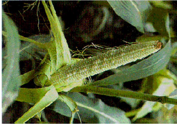
Figure 7 : Epi sans grains dû à une mauvaise pollinisation.

qu'un grand nombre d'insectes est présent, des pertes de rendement peuvent s'ensuivre à cause d'une pollinisation réduite (figure 7). Quand la pollinisation est terminée, l'alimentation des adultes n'occasionne plus de diminution de rendements.