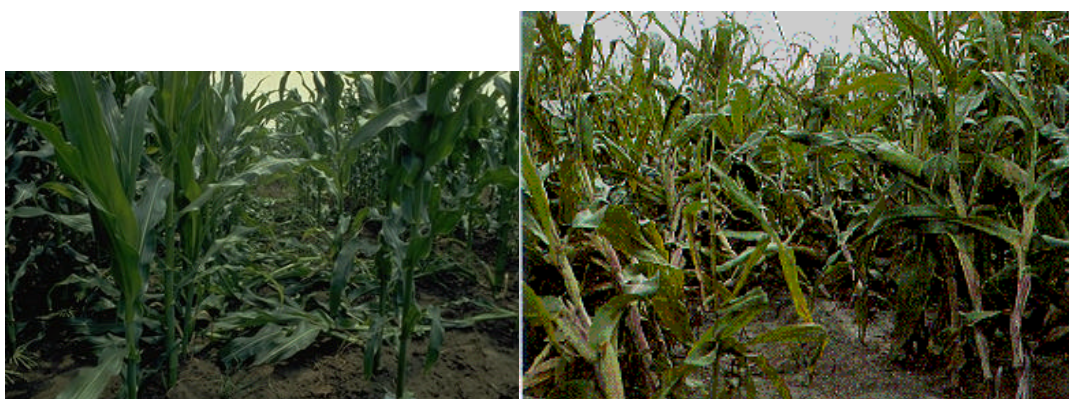
Figure 6 : Verse et plants en col de cygne dus à l'alimentation des larves sur les racines (b- source Ministère Agriculture, de l'Alimentation et des Affaires Rurales, Ontario)

Les plants dont le système racinaire est endommagé sont peu vigoureux car ils ne peuvent absorber suffisamment d'eau et d'éléments nutritifs. De plus, des plants affaiblis peuvent pencher (ou verser), surtout pendant une pluie ou une tempête. Dans un effort pour se redresser, les plants se recourbent et prennent la forme caractéristique du "col de cygne" (figure 6). Si la verse a été importante, les pertes à la récolte peuvent aussi contribuer à la diminution des rendements.