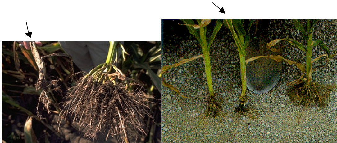
Figure 5 : Racines gravement endommagées comparé à des racines saines (a- source EPPO, Prof. Edwards, Purdue University, USA) (b- source Ministère de l'Agriculture, de l'Alimentation et des Affaires Rurales, Ontario)

Les plants dont le système racinaire est endommagé sont peu vigoureux car ils ne peuvent absorber suffisamment d'eau et d'éléments nutritifs. De plus, des plants affaiblis peuvent pencher (ou verser), surtout pendant une pluie ou une tempête. Dans un effort pour se redresser, les plants se recourbent et prennent la forme caractéristique du "col de cygne" (figure 6). Si la verse a été importante, les pertes à la récolte peuvent aussi contribuer à la diminution des rendements.