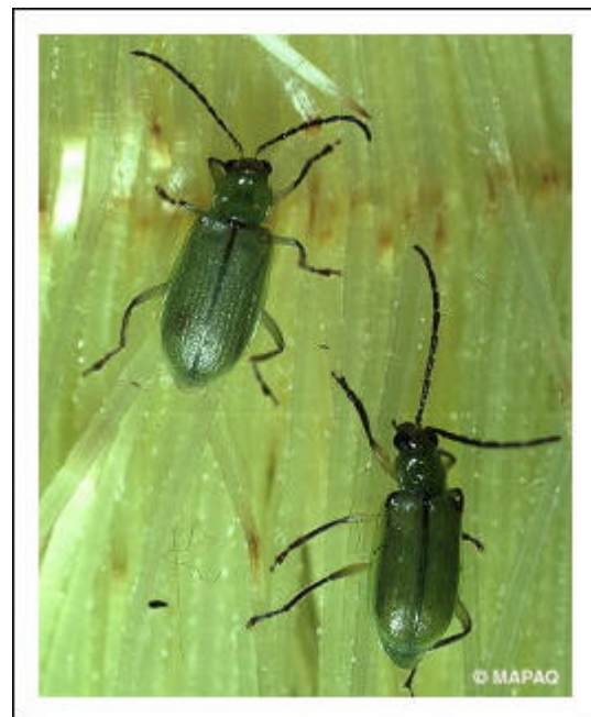
Figure 2 : adultes de Diabrotica barberi